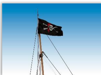
Ahoi, Piraten! Auf großer Fahrt über die sieben Meere! Sommerferien