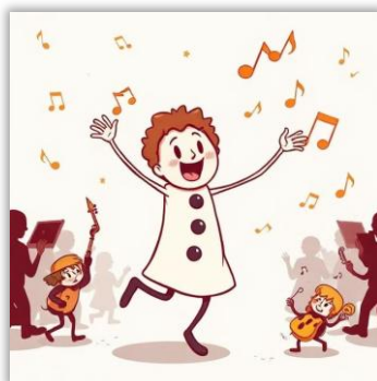
Der Ton macht die Musik! Sommerferien