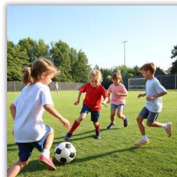
Anpiff in die Sommerferien – Sommer, Sonne, Fußballspaß! Sommerferien