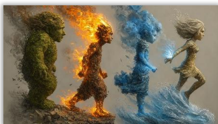
Voll im Element! Die Abenteuer unserer Naturkräfte Faschingsferien