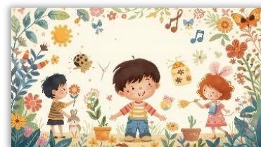
Die 5 Sinne Sommerferien