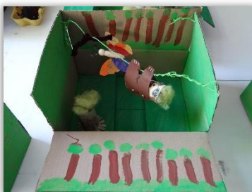
Upcycling macht Spaß! Dosen, Pappkartons und mehr Herbstferien